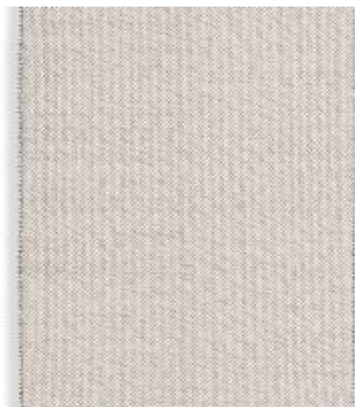
Loumos - natur | 191 007